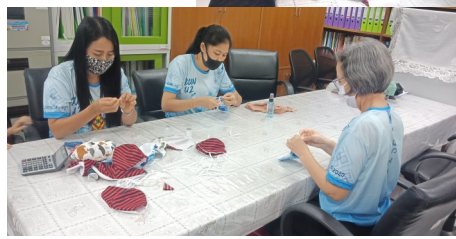
บุคลากรฝ่ายตรวจสอบภายในร่วมกิจกรรมจิตอาสา เย็บหน้ากากอนามัย มอบให้ห้องพยาบาล มหาวิทยาลัยทักษิณ วิทยาเขตสงขลา เพื่อให้บุคลากร และนิสิตได้นำไปใช้ป้องกันการติดเชื้อไวรัส COVID—19 วันที่ 23 มีนาคม 2563