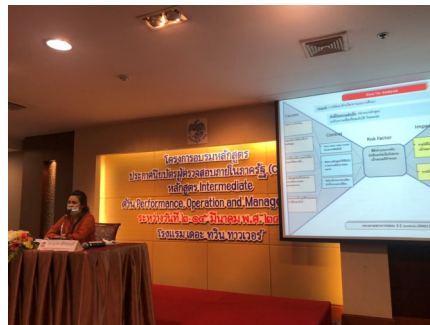
นางสาวพุดตา ขาวพิมล เข้าร่วมโครงการอบรม (CGIA) หลักสูตร Intermediate ด้าน Performance Operation and Management รุ่น 1 ระหว่างวันที่ 2 - 15 มีนาคม 2563 ณ โรงแรมเดอะทวิน ทาวเวอร์ กรุงเทพมหานคร