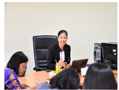
โครงการฝ่ายตรวจสอบภายในพบหน่วยรับตรวจ: คณะคณะอุตสาหกรรมเกษตรและชีวภาพ ณ วิทยาเขตพัทลุง วันที่ 5 มีนาคม 2563