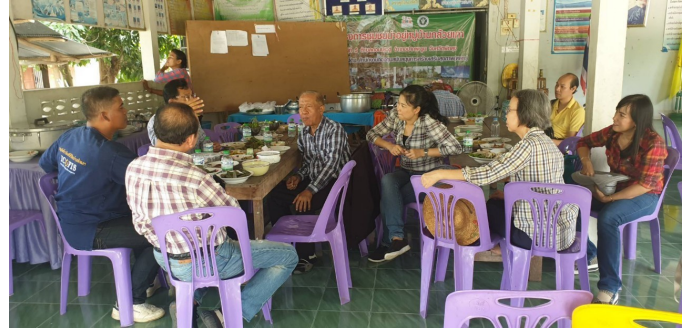
ฝ่ายตรวจสอบภายในลงพื้นที่เพื่อติดตามปัญหาอุปสรรคในการดำเนินงานของสถาบันปฏิบัติการชุมชนเพื่อการศึกษาแบบบูรณาการ วันที่ 17 มกราคม 2563 ณ ชุมชนบ้านดอนประดู่ อำเภอปากพูน จังหวัดพัทลุง